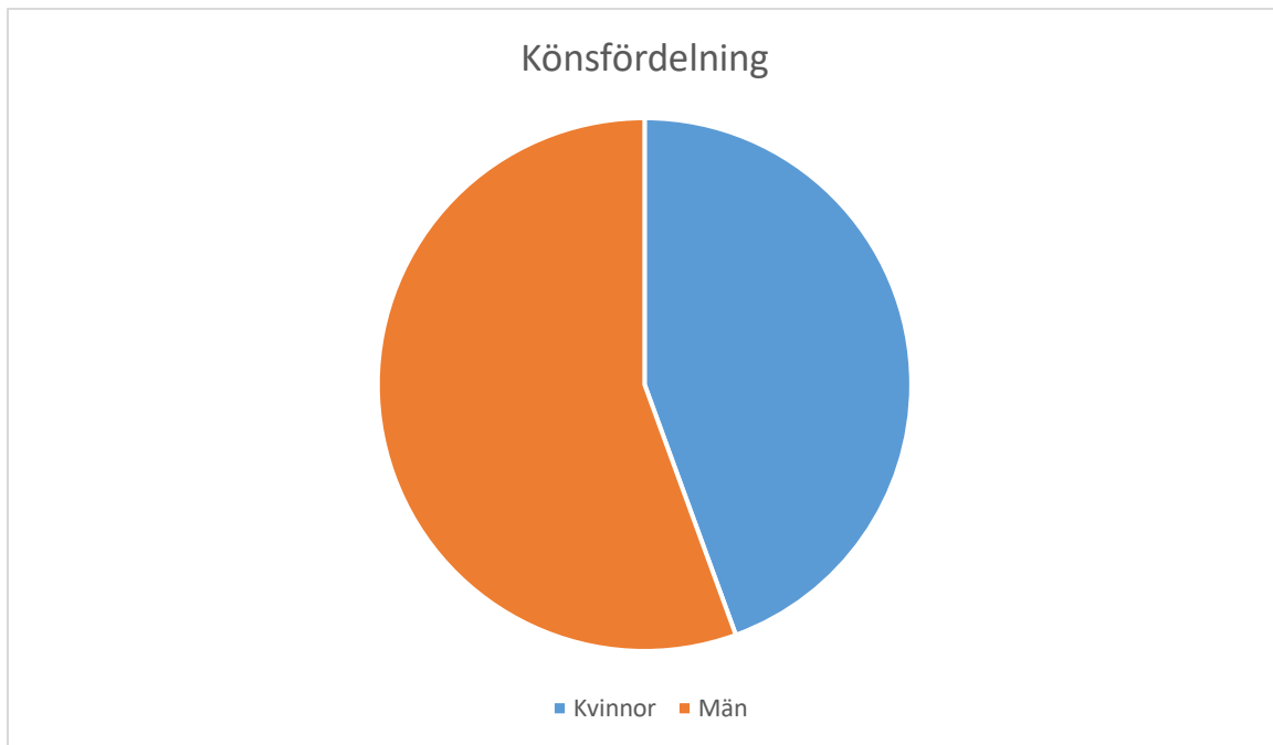
Diagram 2. Könsfördelning för deltagare i revisionen

Hur länge brukarna i revisionen har haft insatsen boendestöd varierar, allt ifrån några månader till 10 år. Majoriteten har dock haft sitt boendestöd 0-2 år. Fördelningen av boendestödsinsatsens längd för svarsgruppen illustreras i diagram 3.